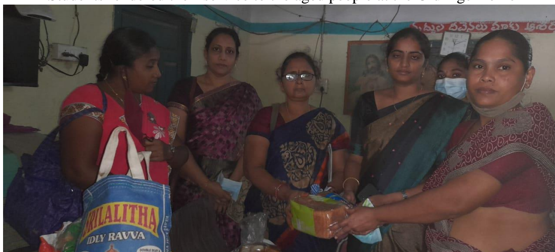
Offered groceries and bread to the inmates of the OAH.