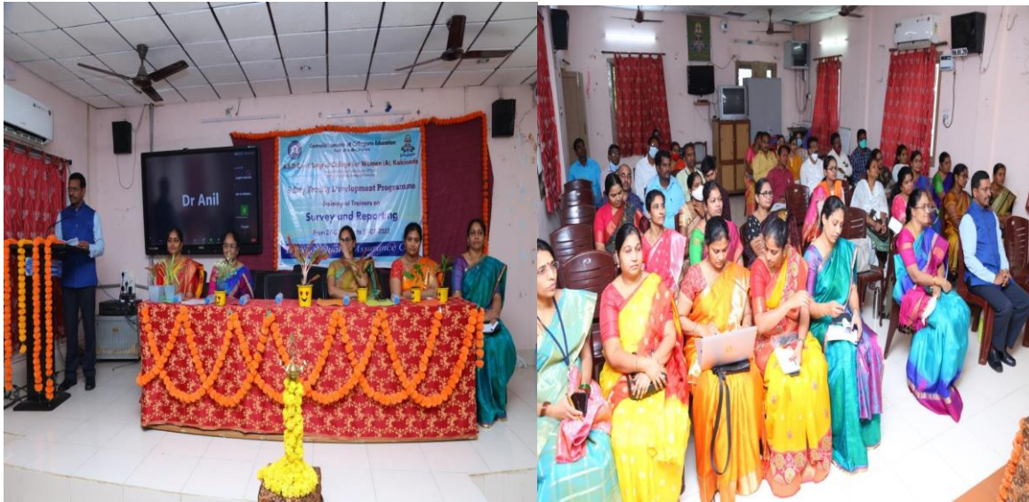
Honourable RJD's addressing at the inaugural session of the FDP: Survey & Reporting