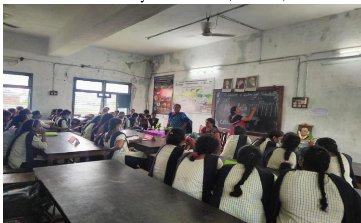
A Quiz on the topic, “Recent Advances in the Field of Genetics”