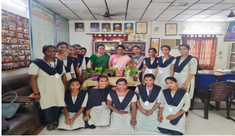
Students with their mentors after making pots