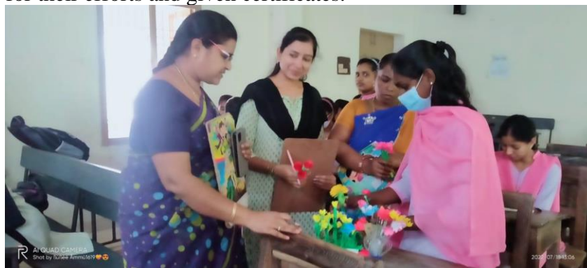
Judges examined and evaluated the competitors' models