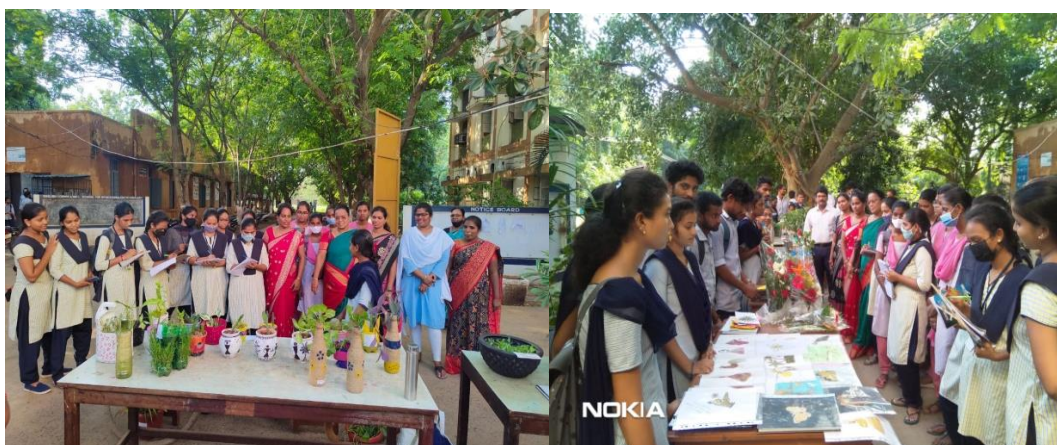
Horticulture students jotted points on the various Exhibits displayed by their peers