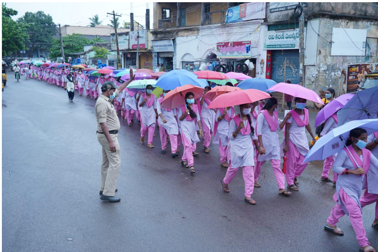
500 Students participated in Rally on 1 July 2022 as a part of Aajadi Ka Amrit Mahotsav and carried umbrellas sponsored by ONGC.