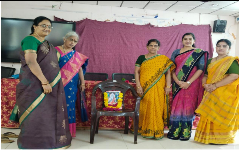
Vyasa Guru Poornima/Vyasa Jayanti was observed by the Departments of Sanskrit, Telugu and Hindi on 13/07/2022