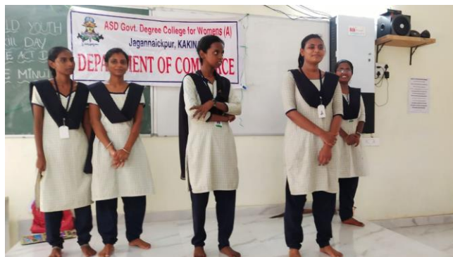
World Youth Skill Day Celebrations - 15/07/2022